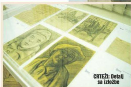
CRTEŽI: Detalj sa izložbe